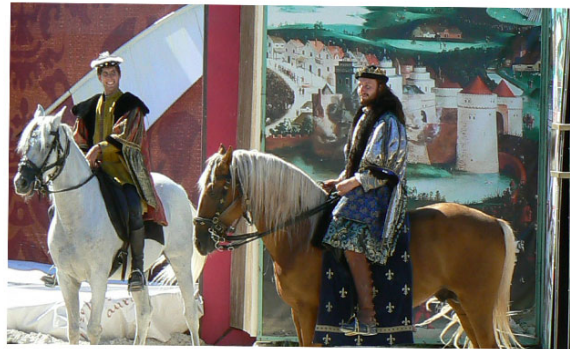
Une Journée à Chambord