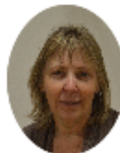
MARTINE FERMÉ à ST-LUBIN CM1 et CM2